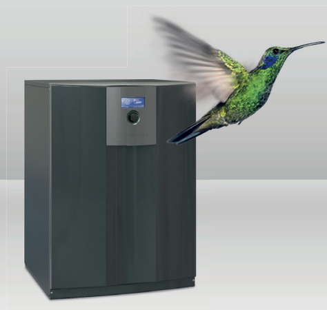
Seeria SW 4-19 kw