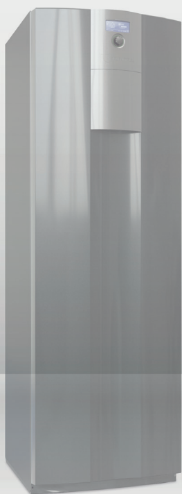
Seeria WZS 4-12 kw | on/off | 2-16 kw | inverter |