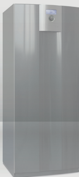
Seeria SWC 4-19 kw | on/off | 2-16 kw | inverter |